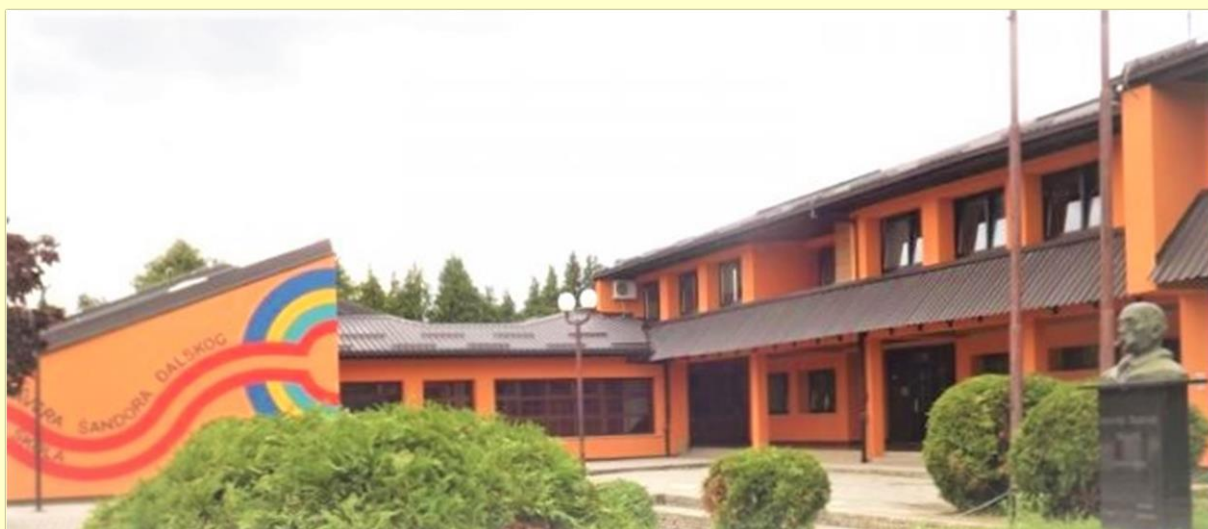
OŠ Ksavera Šandora Đalskog, Donja Zelina