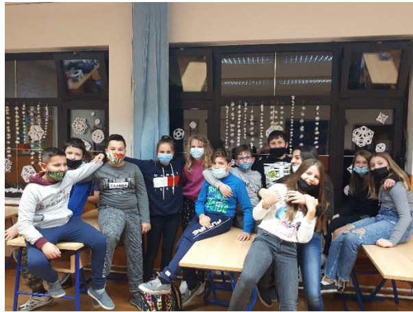
U 5.n snijeg je najprije "pao"