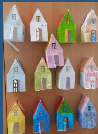
Kućice s porukama prijateljstva

“Snijeg svud pada, zvona zvone, srca mlada vesele se. To je vrijeme ljubavi i mira, sretan Božić svakome!”